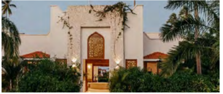
LUX MARIJANI - ZANZIBAR BEACH (link)