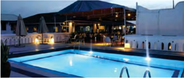
MARU MARU - STONE TOWN (link)