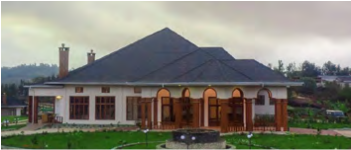
NGORONGORO COFFEE LODGE - NGORO NGORO (link)