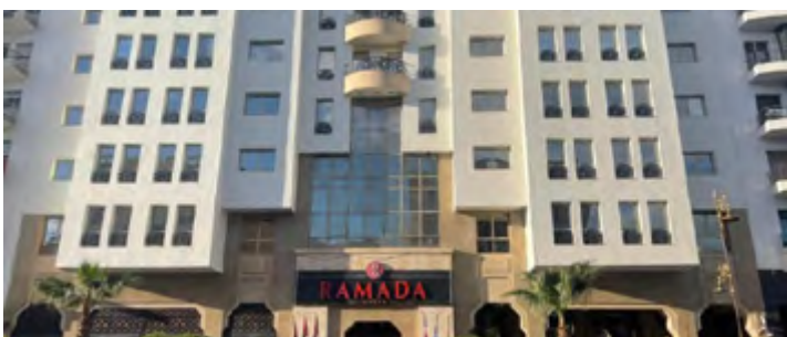
RAMADA BY WYNDHAM 5* 2 NYXΤΕΣ ΜΕ ΗΜΙΔΙΑΤΡΟΦΗ (link)