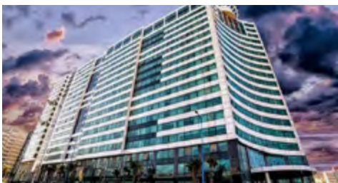
MOGADOR CENTER HOTEL 5* 1 NYXΤΑ ΜΕ ΗΜΙΔΙΑΤΡΟΦΗ (link)