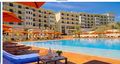
PALAIS MEDINA HOTEL 5* 2 NYXΤΕΣ ΜΕ ΗΜΙΔΙΑΤΡΟΦΗ (link)